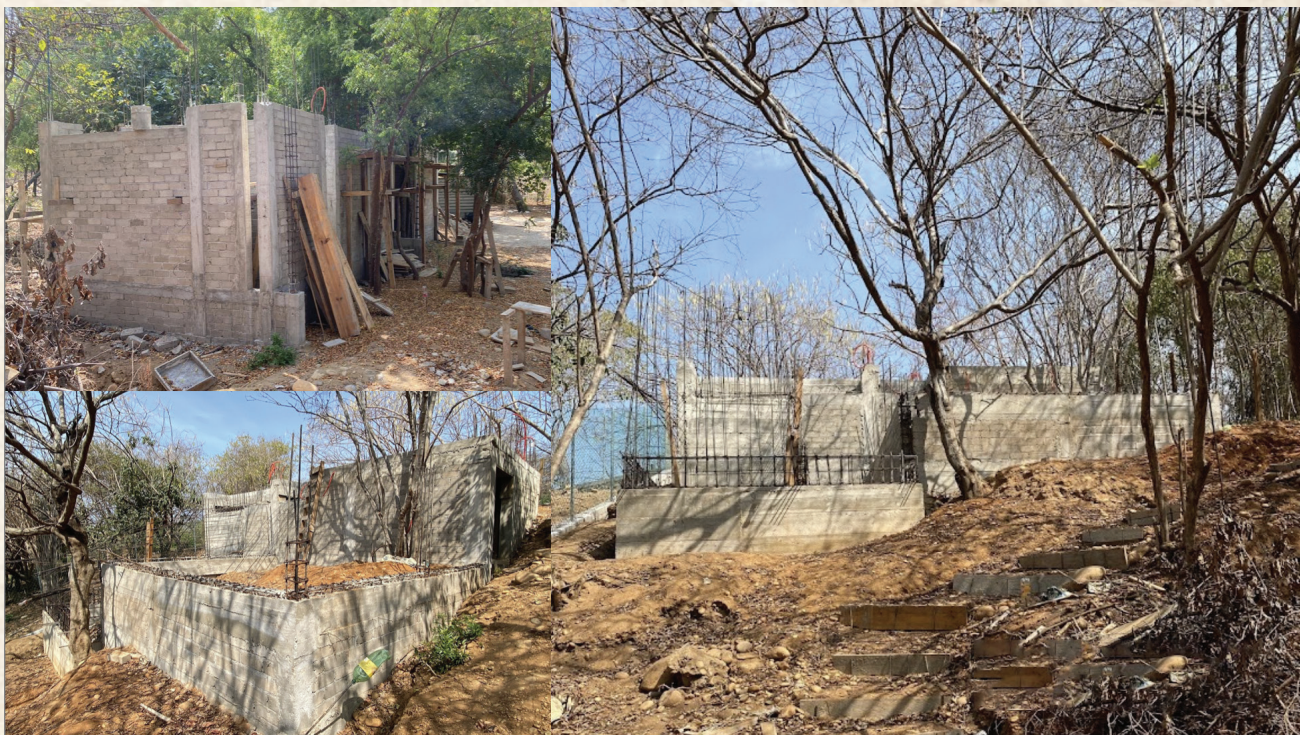
Avance de obra