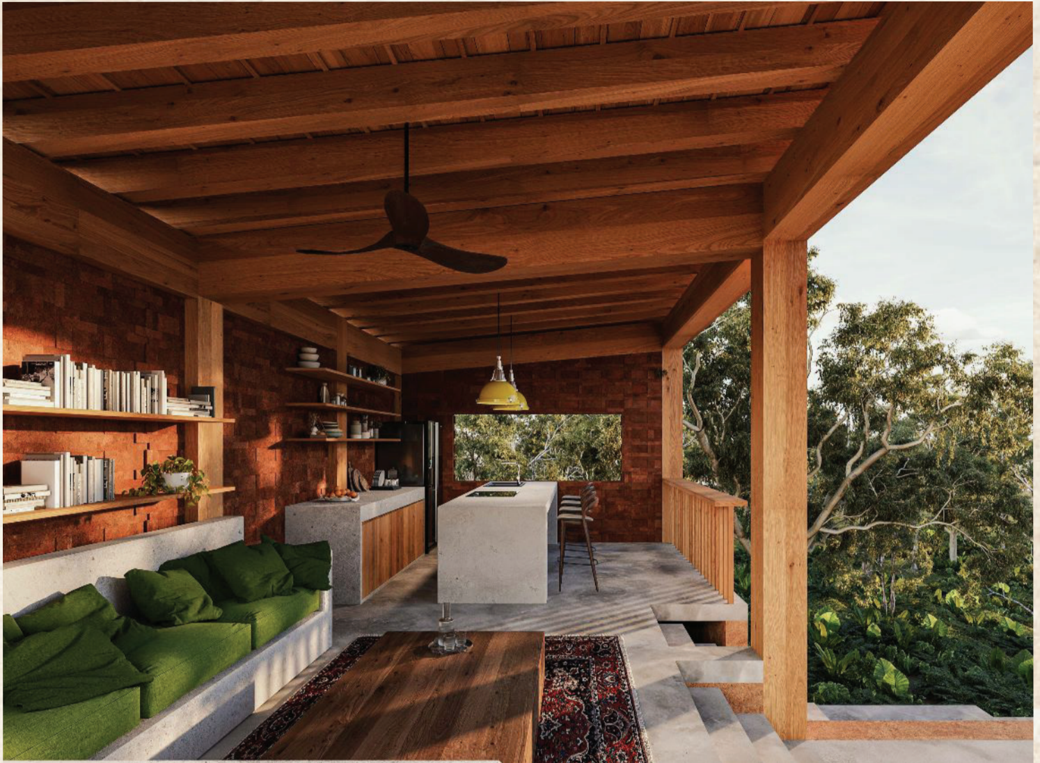
Sala / Cocina