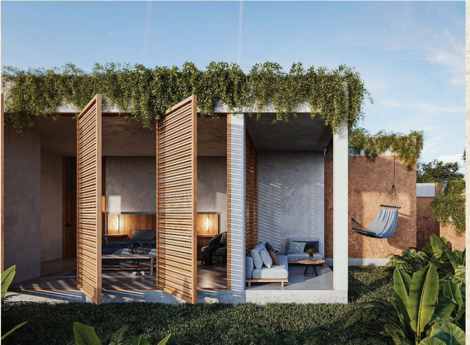
Habitación con terraza privada